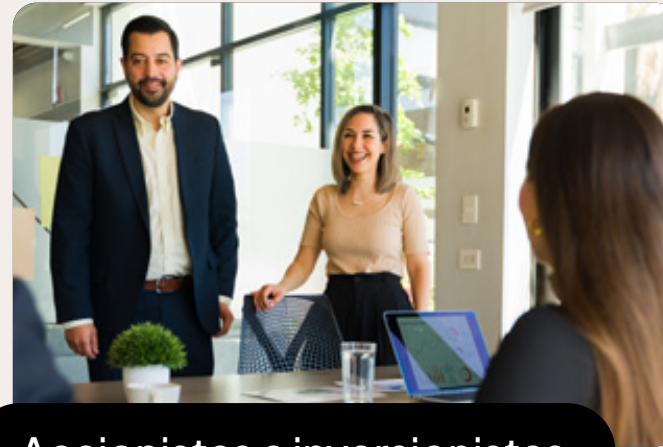
Accionistas e inversionistas

La perspectiva de nuestros grupos de interés constituye un pilar para la planeación en la Compañía. Su visión colectiva enriquece nuestra comprensión del contexto social y económico, asegurando que nuestra estrategia evolucione en sintonía con las expectativas del entorno.